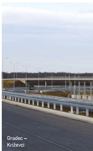
Gradec – Križevci

Brza cesta Gradec – Križevci duga 12,4 kilometra u rujnu bi trebala biti otvorena za promet. Poručuju to iz HAC-a navodeći da je cesta gotovo potpuno dovršena i da se tehnički pregled planira u kolovozu, nakon čega slijedi primopredaja dionice Hrvatskim cestama. Ukupna vrijednost ulaganja procjenjuje se na 610 milijuna kuna, što uključuje otkup zemljišta, projektiranje i gradnju. Inače, ta je dionica dio Podravskog ipsilona, projekta koji je pokrenula Sanderova vlada uoči lokalnih izbora 2009. radi gradnje autoceste iako nije osigurala proračunski novac. Radovi su tekli sporo, a zbog nedostatka novca Milanovićeva je vlada 2012. Podravski ipsilon preategorizirala u brzu cestu. Od tada se gotovo ništa nije napravilo, tek su ove godine intenzivirani radovi. Cesta Gradec – Križevci tek je prva faza gradnje Podravskog ipsilona, u koju je uključena i gradnja ceste Vrbovec 2 – Farkaševac duga 10,8 kilometara. Iz HAC-a poručuju kako je na toj ce-